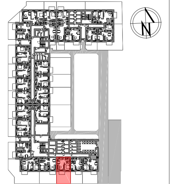
PARTER SCHEMAT LOKALIZACJA MIESZKANIA

"APARTMENT" Sp. z o.o. ul. Nowogrodzka 42 lok. 401 00-695 Warszawa