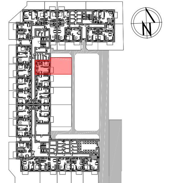
PARTER SCHEMAT LOKALIZACJA MIESZKANIA