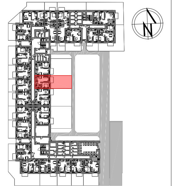
PARTER SCHEMAT LOKALIZACJA MIESZKANIA

"APARTMENT" Sp. z o.o. ul. Nowogrodzka 42 lok. 401 00-695 Warszawa