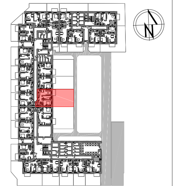
PARTER SCHEMAT LOKALIZACJA MIESZKANIA