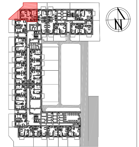
PARTER SCHEMAT LOKALIZACJA MIESZKANIA